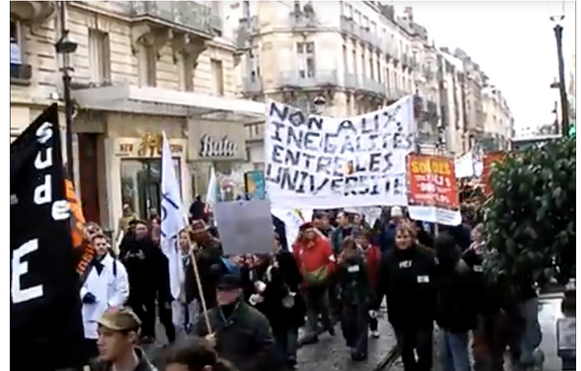
Plusieurs centaines de manifestant.es de l'université dans les rues d'Orléans en février 2009

*Source : rapport d'évaluation Hcéres du CNRS