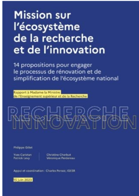
Rapport Gillet, rendu en juin 2023