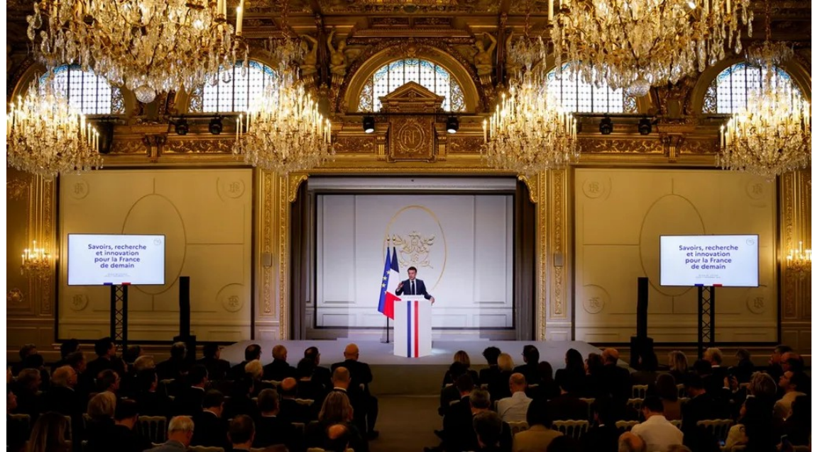
Emmanuel Macron a réuni, ce jeudi 7 décembre 2023, à l'Elysée, plus de 300 représentants du monde de l'enseignement supérieur et de la recherche.

Le président de la République a annoncé vouloir « d'ici à 18 mois d'ouvrir l'acte 2 de l'autonomie et d'aller vers la vraie autonomie avec des vrais contrats pluriannuels où on a une gouvernance qui est réformée », ainsi qu'une « différenciation assumée » entre les universités via des politiques de site. Concernant les organismes de recherche : « faisons des vraies agences de financement qui arrêtent de gérer directement les personnels ». Tout cela « à marche forcée ».